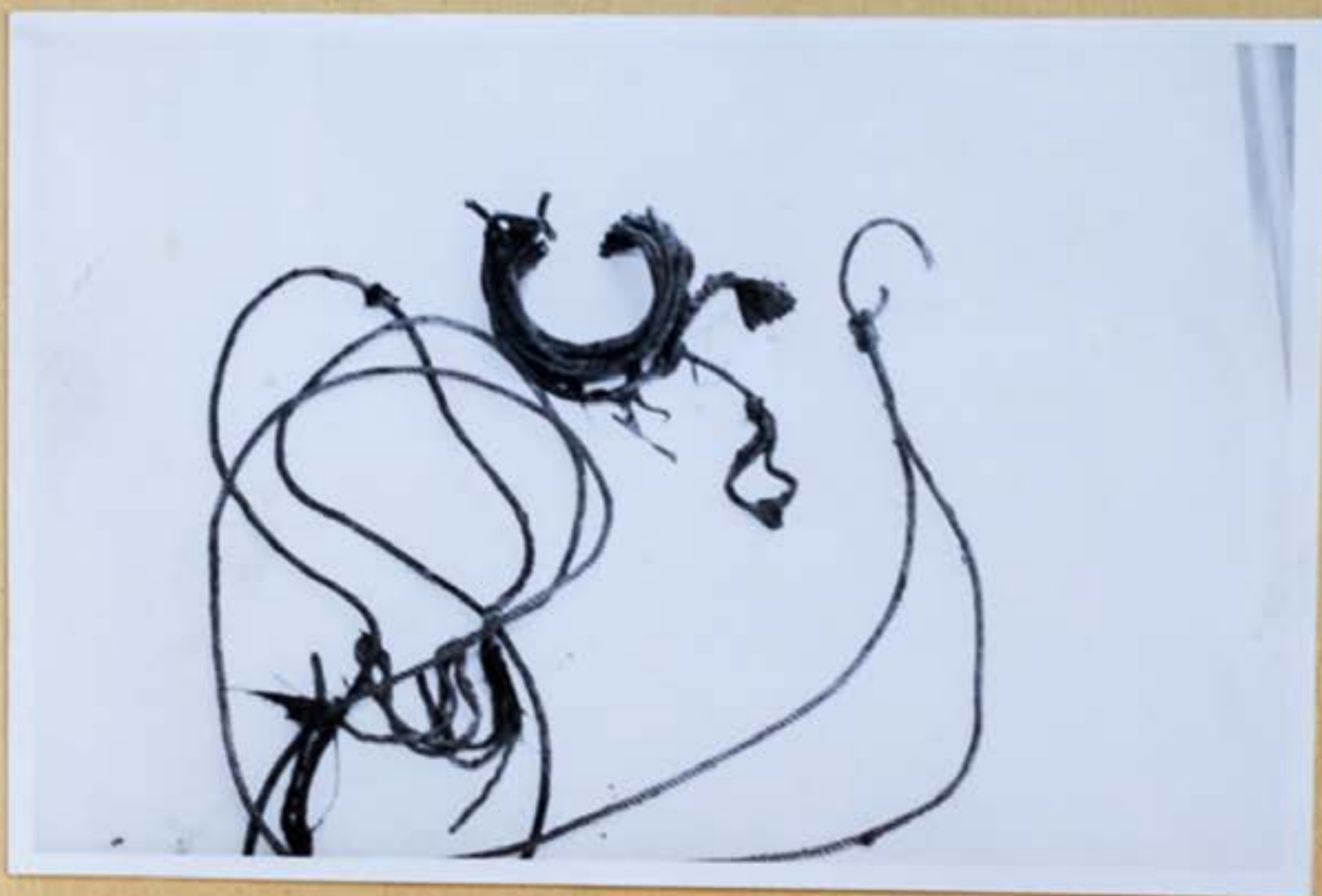
9. Celkový pohľad na šnúru sňatú z rúk Ľ.Cervanovej