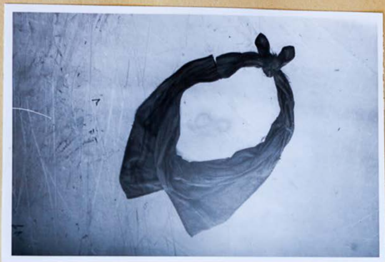
10. Vreckovka ktorú mala mrtvola L.Cervanová na krku