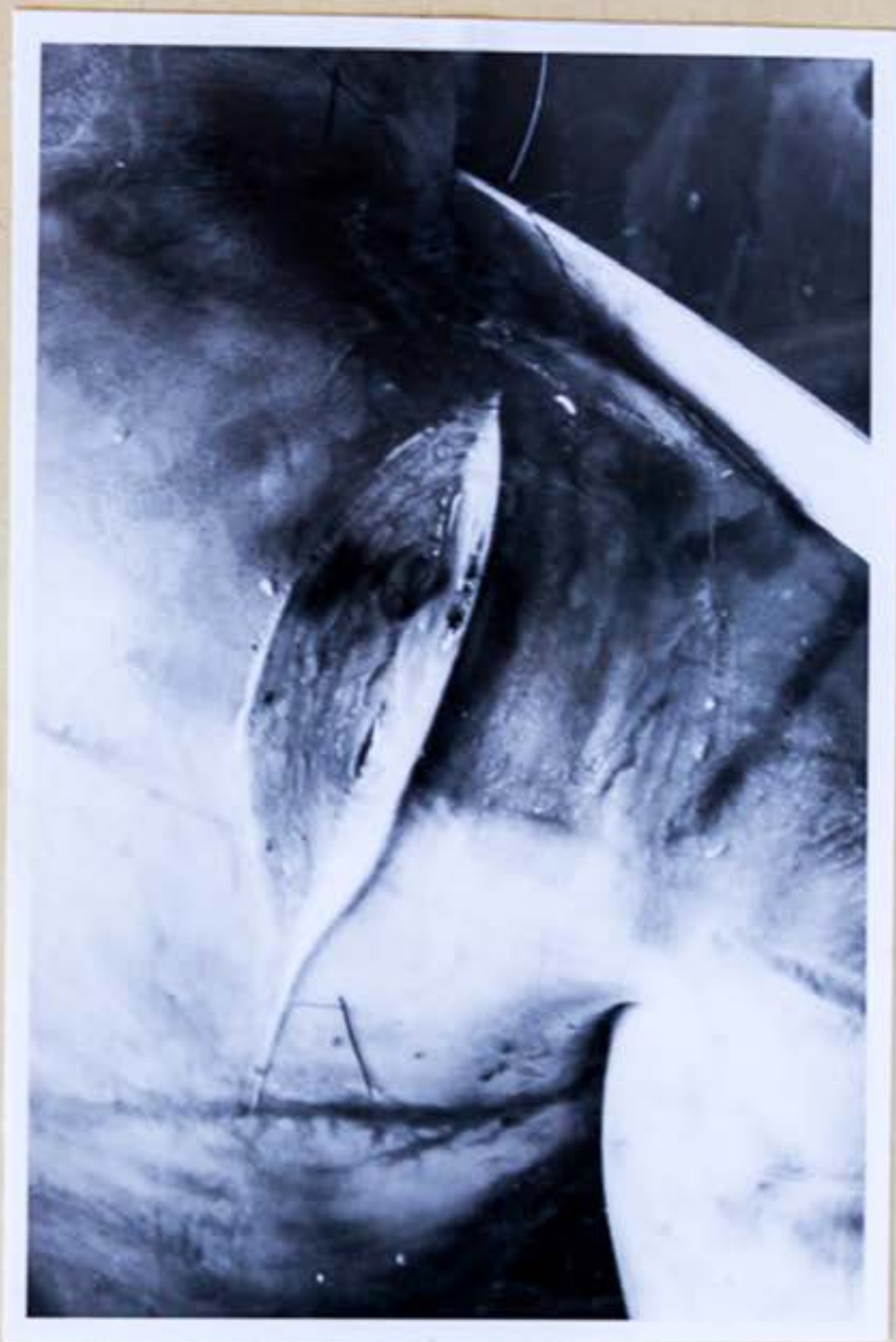
7. Pri pitve zistený krvný výron na pravej lopatke