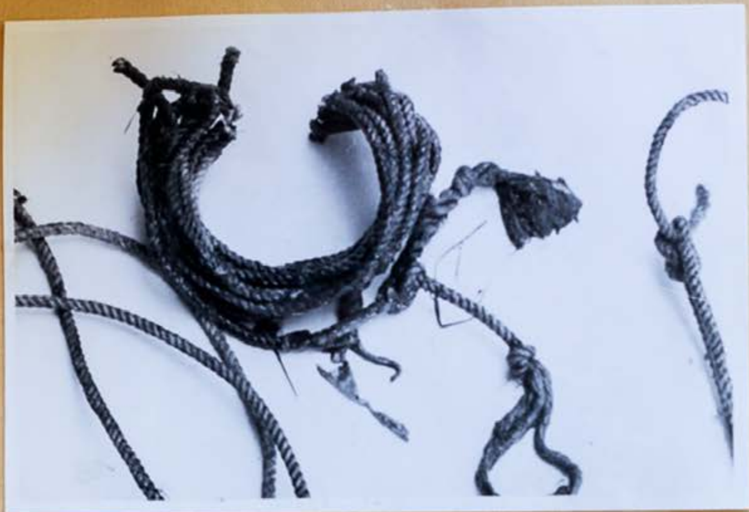
8. Detail omotku šnóry sätý z rúk mrtvoly Ľ.Cervanovej ako aj osobitne privityazanej šnóry v zápästí pravej ruky .