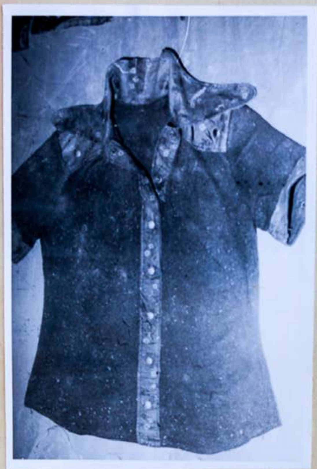
12. Pletený tmavomodrý sveter s krát.rukávami lemovaný golierom, na pleciach na kococh rukávov a a záložka vpredu kvetovanou látkou.