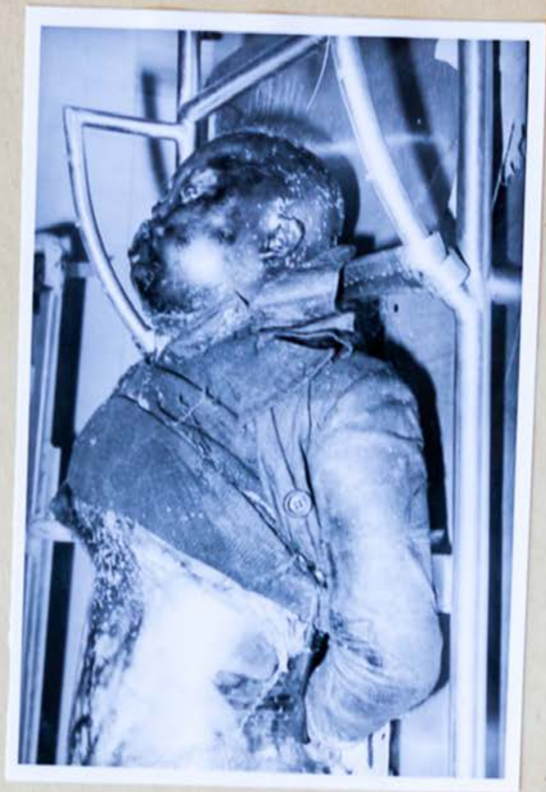
2. Pohľad na oblečenie ktoré mrtvola mala na sebe