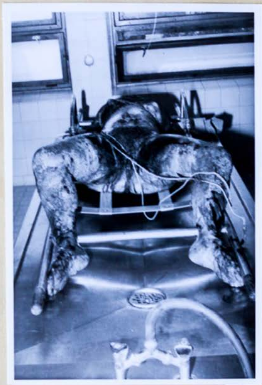
4. Pohľad na mrtvolu I. Cervanovej od nôh