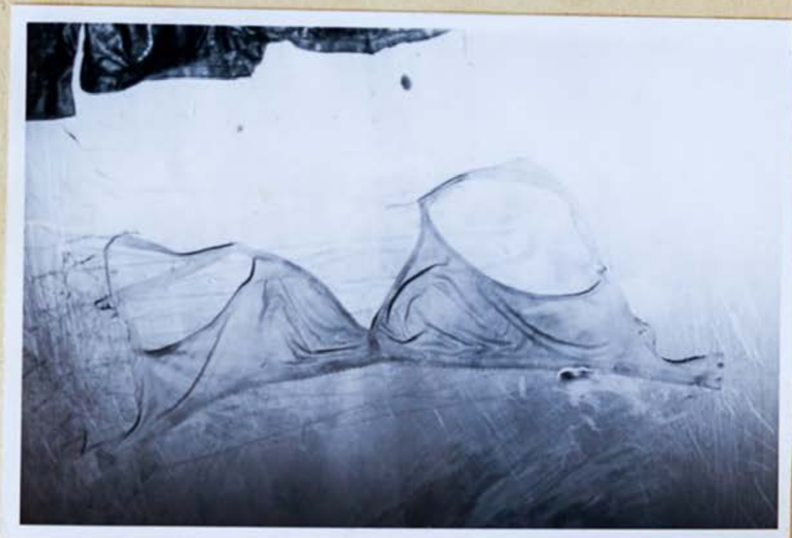
11. Podprsenka ktorú mala L.Cervanová na sebe