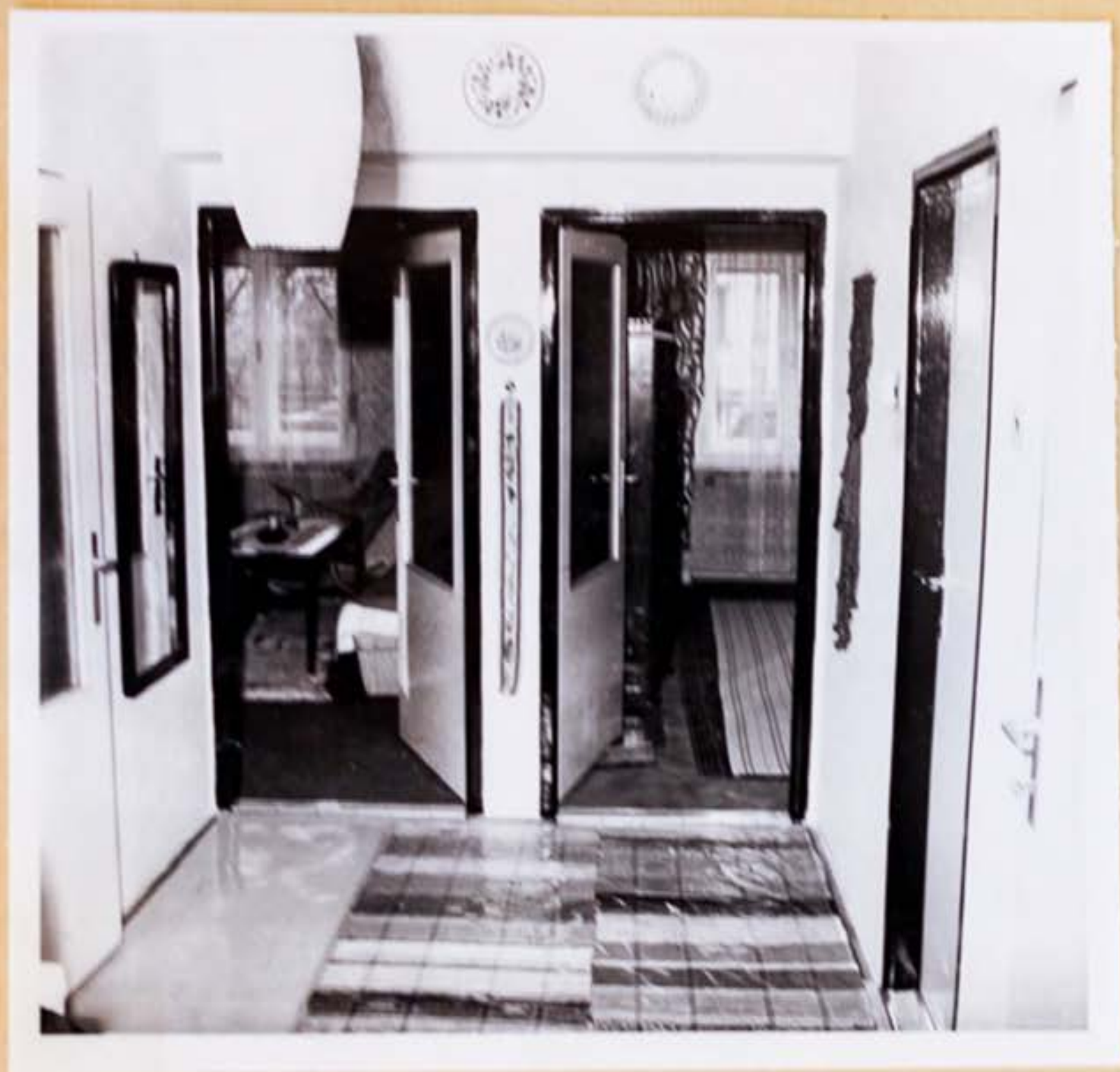
4. / Záber na dvere do druhej miestnosti, ktoré susedia s dverami do miestnosti prvej