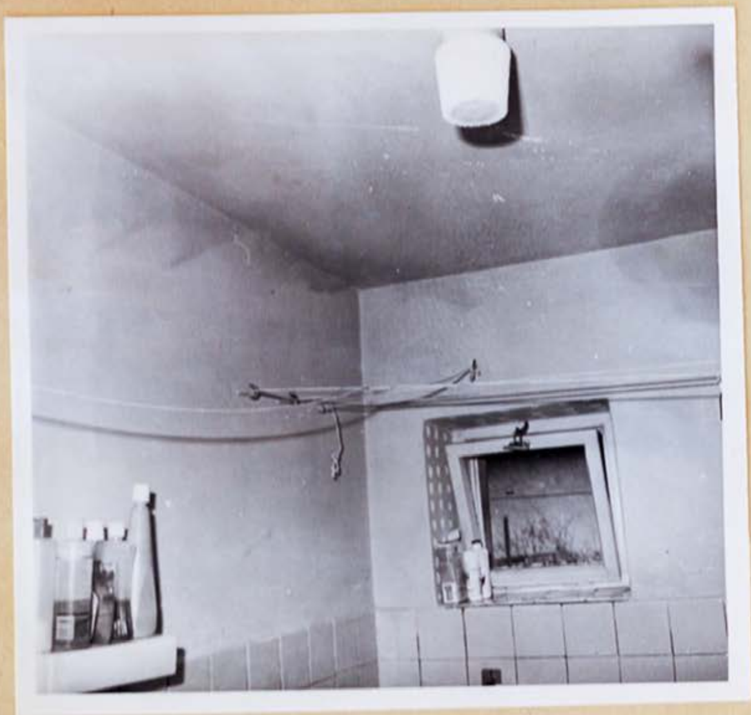
5.a/ Pohľad na šnúry na prádlo v kúpe lni