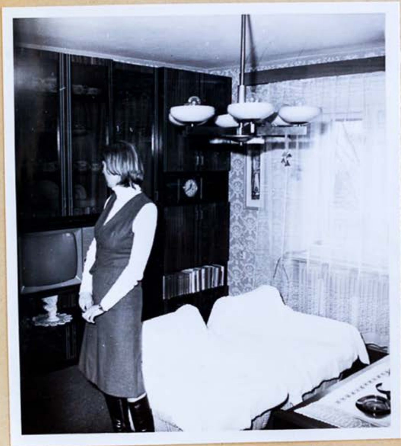
✓ Druhá miestnosť