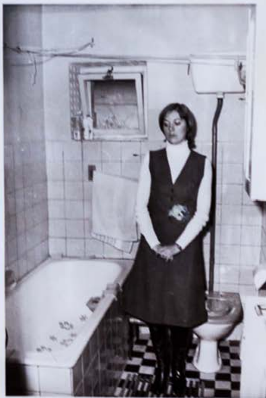
5./ Kúpeľka, kde svedkyňa tiež bola počas večera