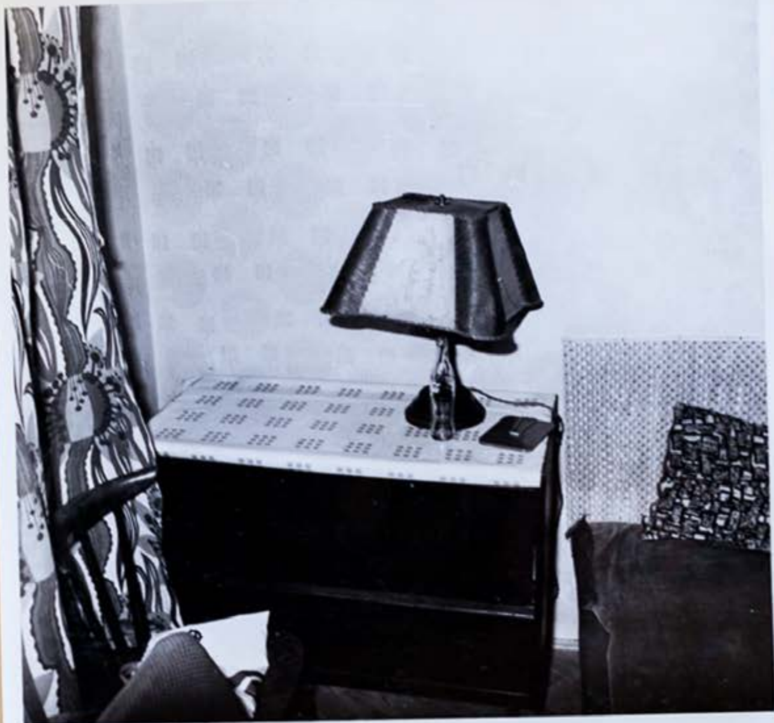
3./ Miesto, kde bol uložený magnetofón