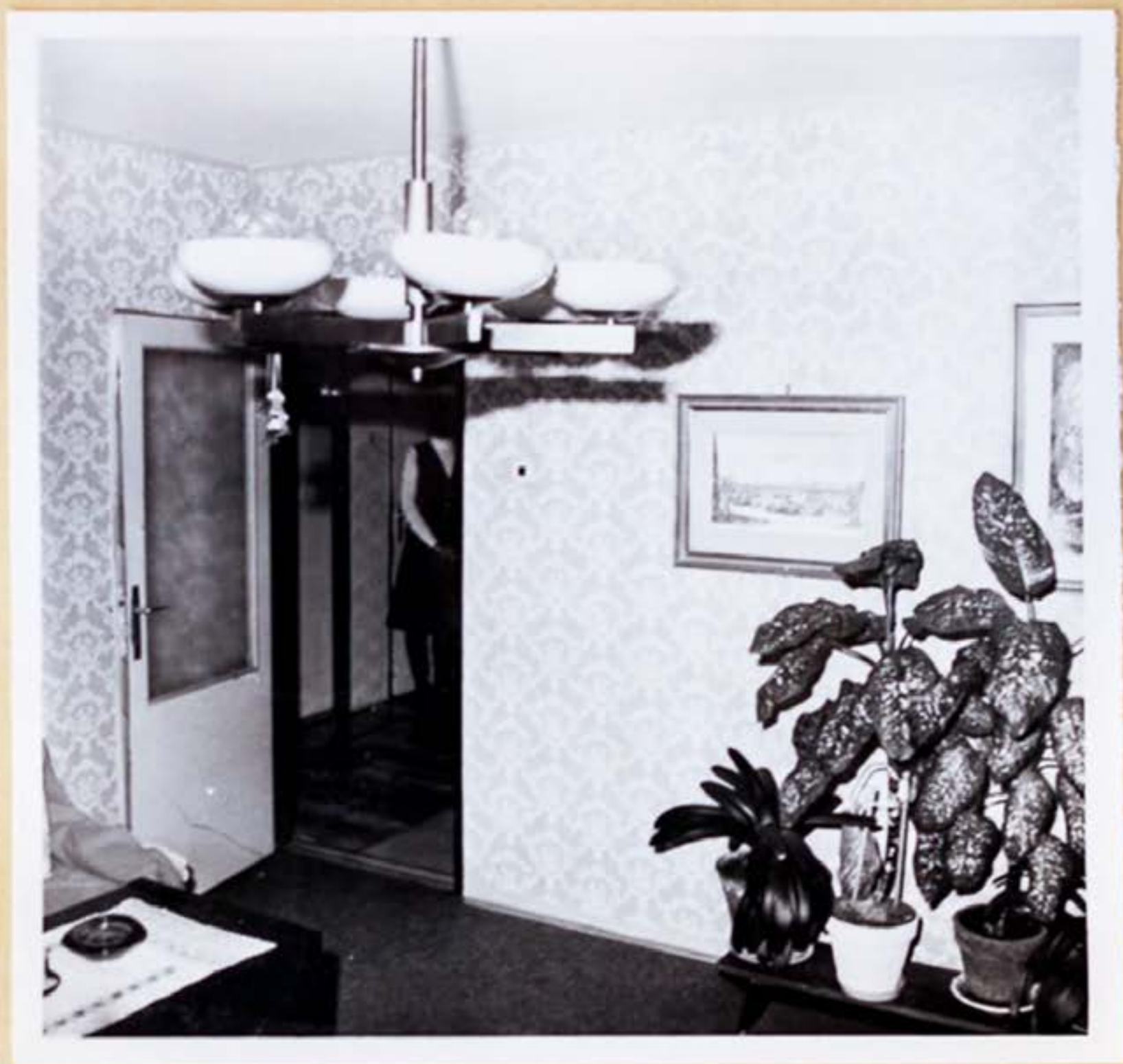
4. 1/ Druhá miestnosť