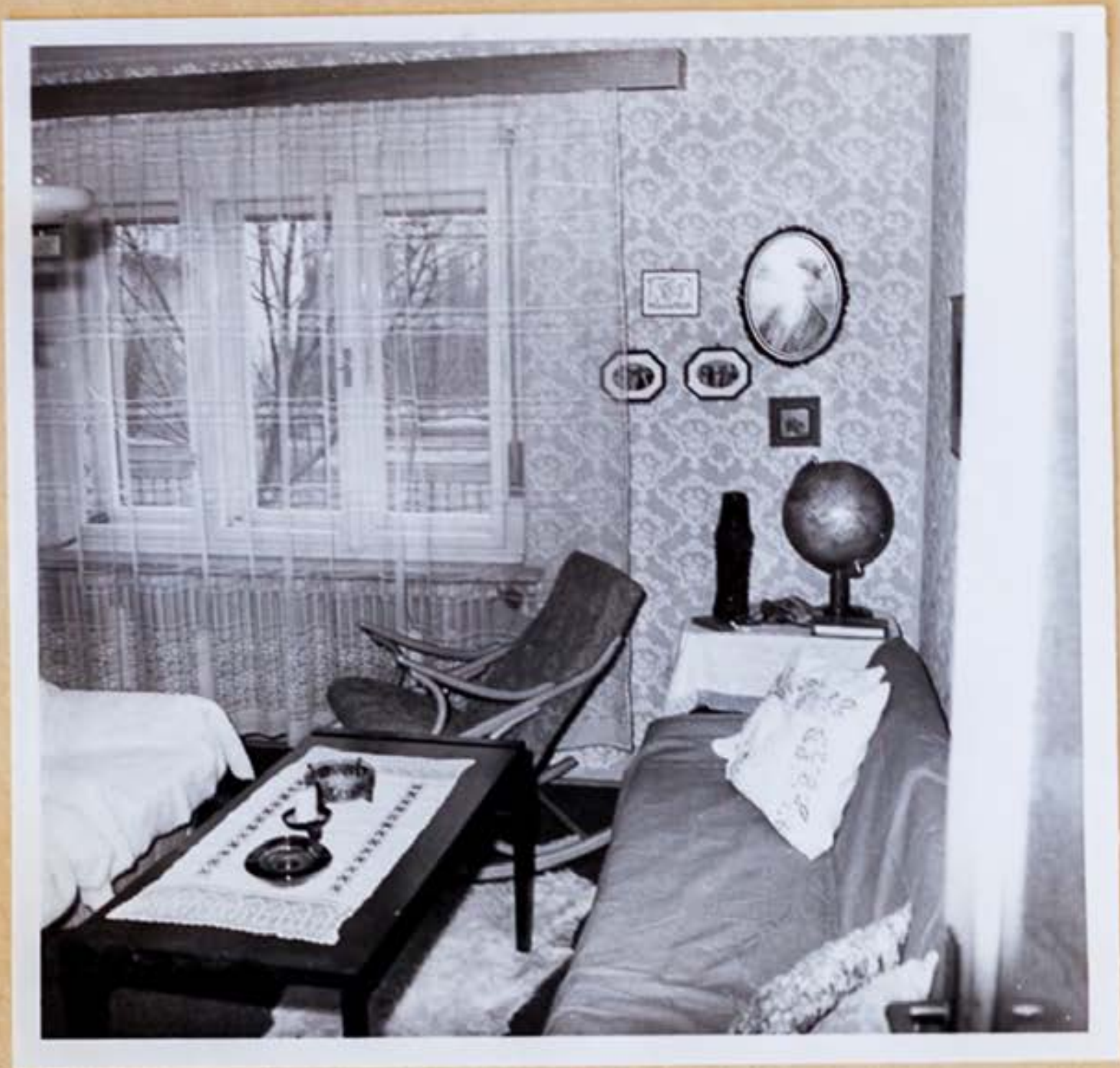
4.b/ druhá miestnosť