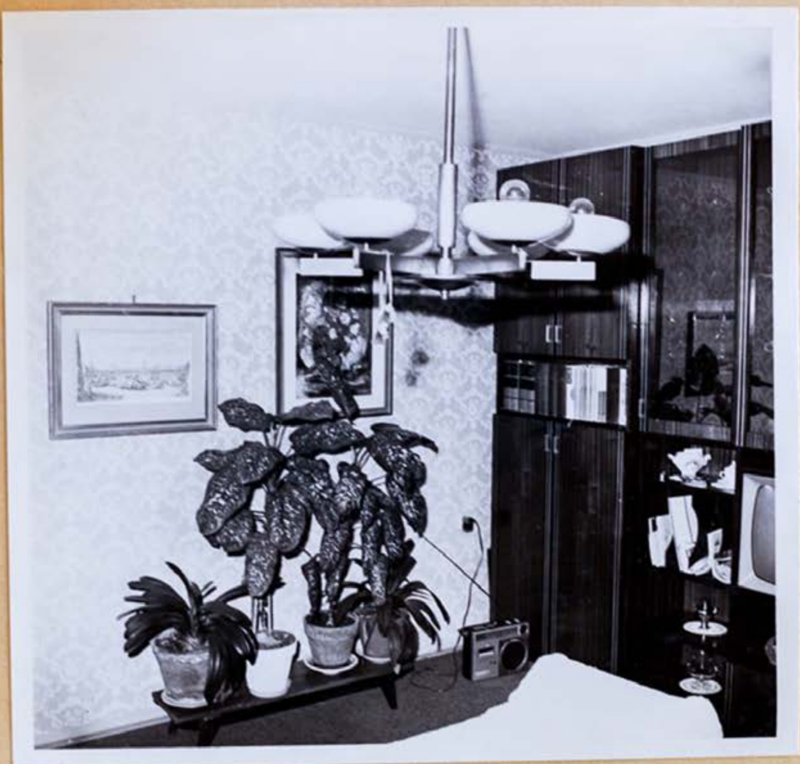
4.c/ Druhá miestnosť