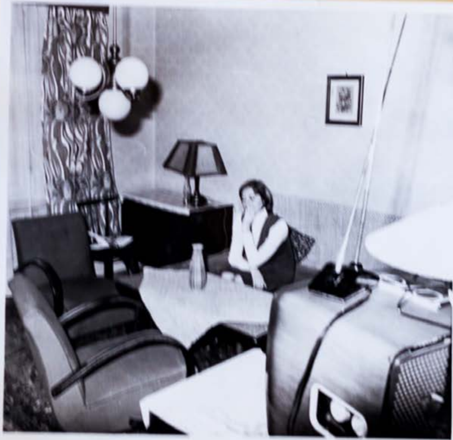
2, a/ Místnost kam přišli po příchodu, válečník, kde seděla Červená, iný pohľad