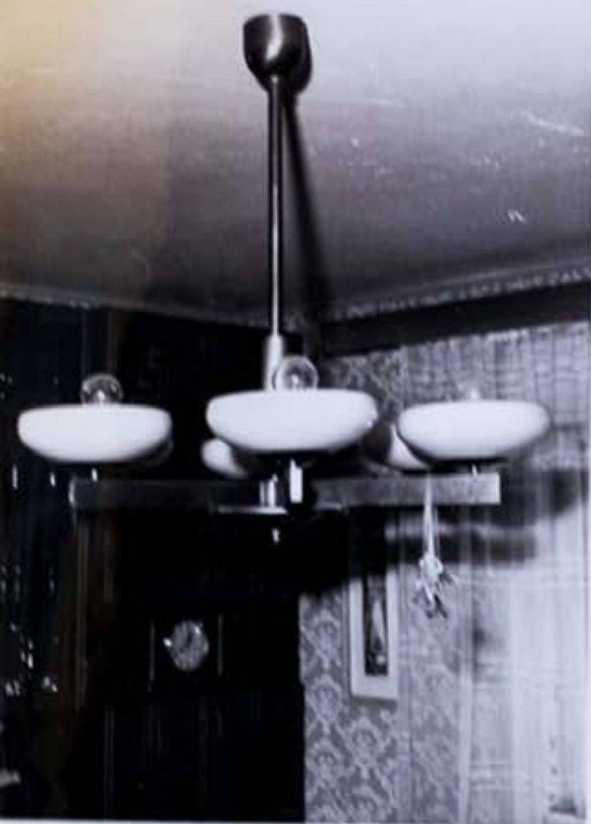
4.e/ Detailný zábet na luster