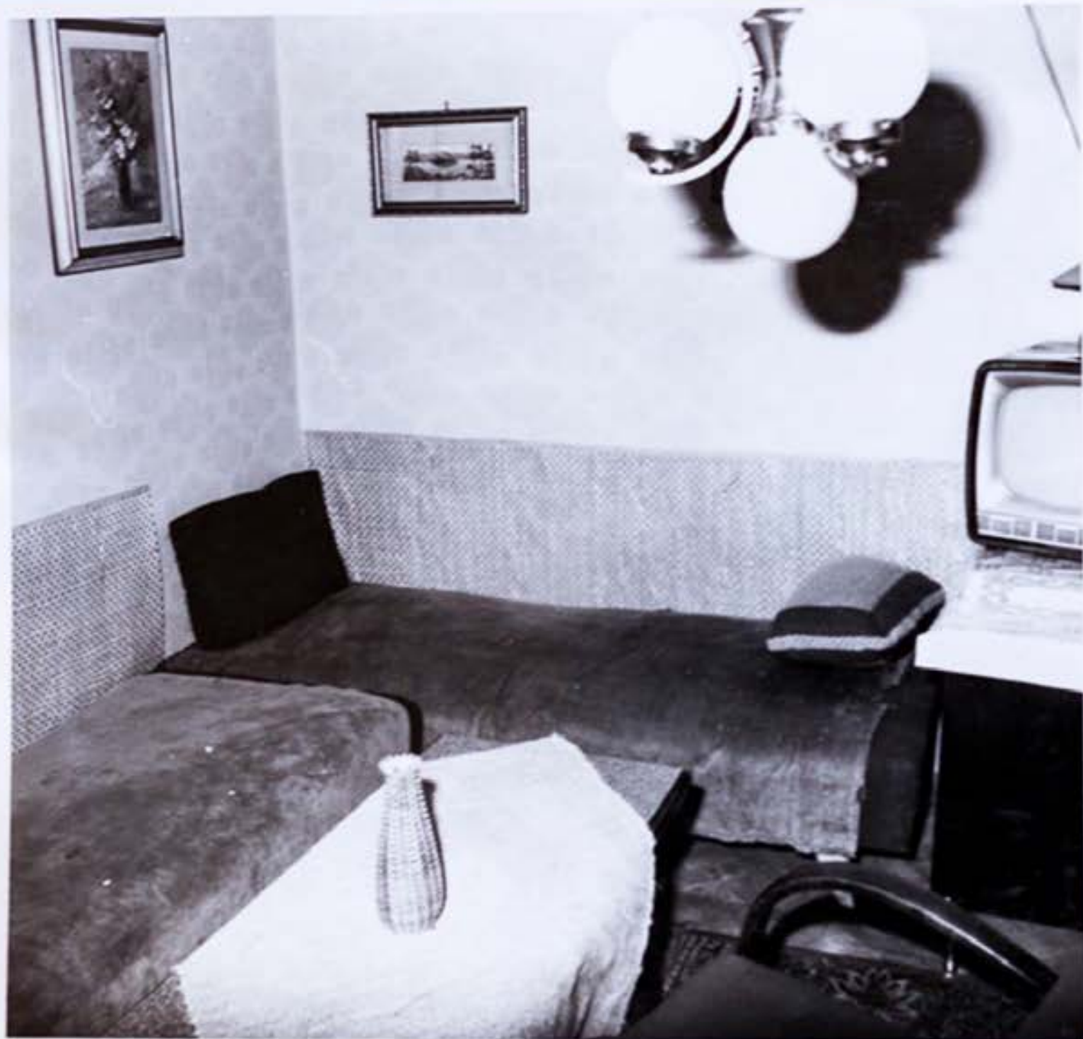
1./ Miestnosť, kam prišli po príchode