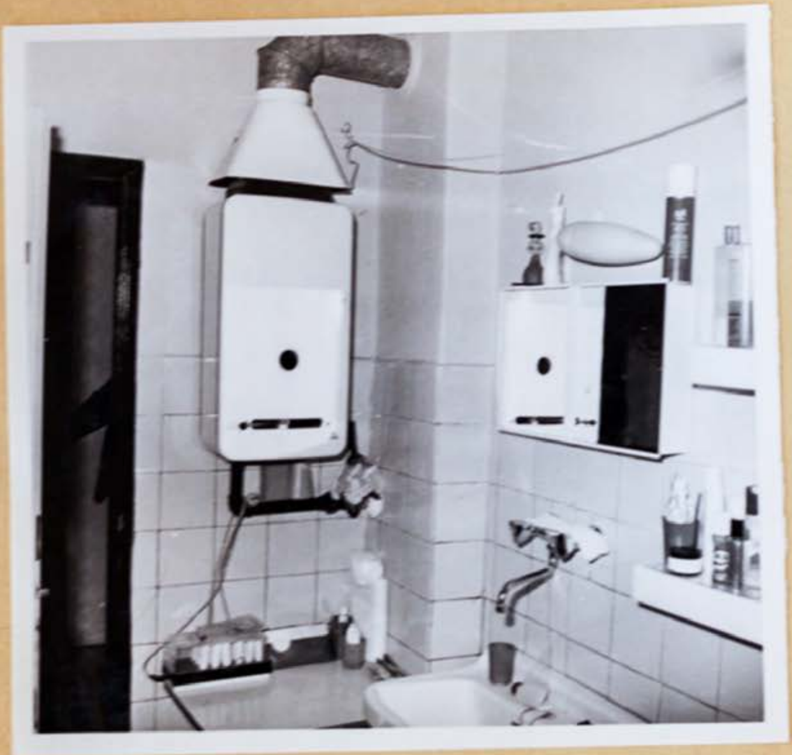
5.c/ Pohľad na šnúru na prádlo