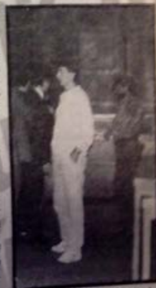
To sa predsa nemohlo skončiť inak. Býť sme nič neurobili.

tak stáva historickým a hovoriť dosť jasne o tom, ako skupina vyšetrovateľov pracovala.